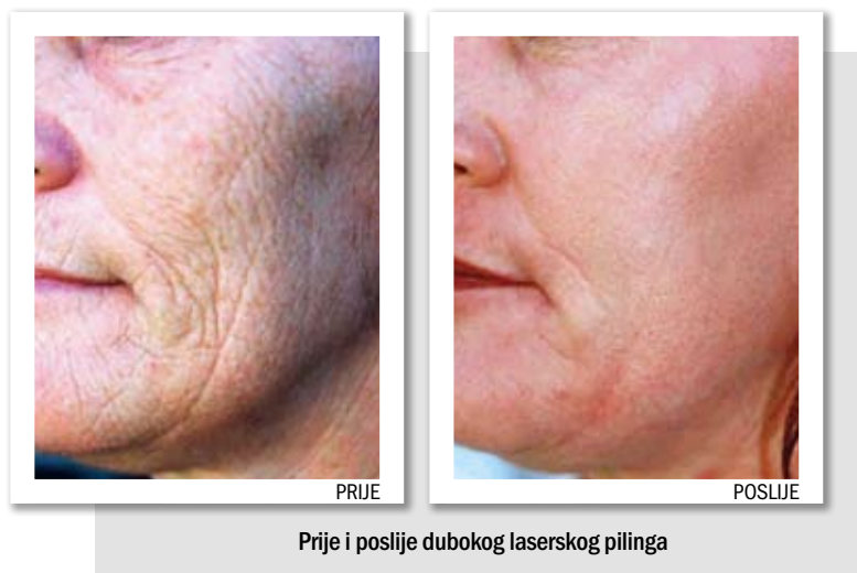
Prije i poslije dubokog laserskog pilinga

LASERSKI LIFTING – blago zatezanje kože uz stimulaciju produkcije kolagena i elastina u dubljim slojevima kože. Odlično za sve one koji se isti ili sljedeći dan moraju vratiti svojim svakodnevnim obavezama.