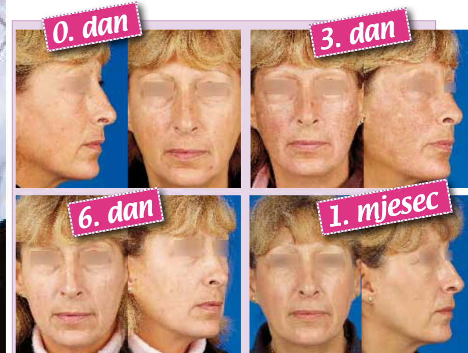
NAKON TRETMANA FRAKCIONALNIM LASEROM na koži se pojavi tanak sloj krastica, koje za nekoliko dana otpadnu i ostane mladolika koža

Lasere su pouzdaniji od kemijskih pilinga, jer se dubina i opseg tretmana mogu preciznije regulirati